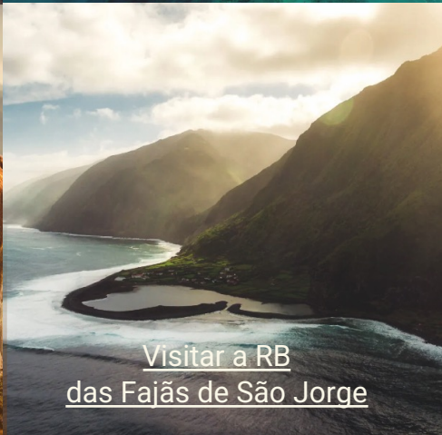
Visitar a RB das Fajãs de São Jorge