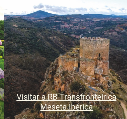
Visitar a RB Transfronteiriça Meseta Ibérica