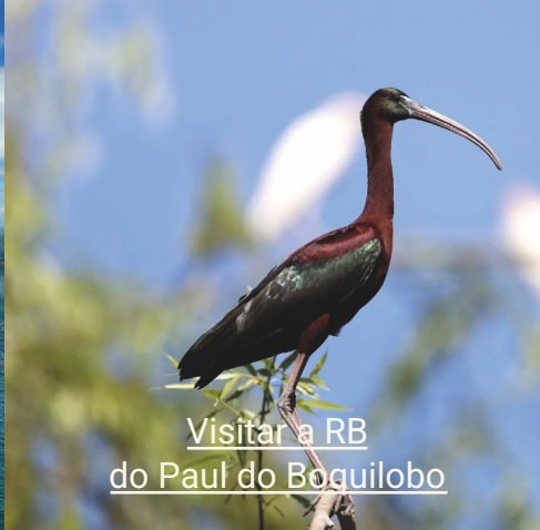
Visitar a RB do Paul do Boguilobo