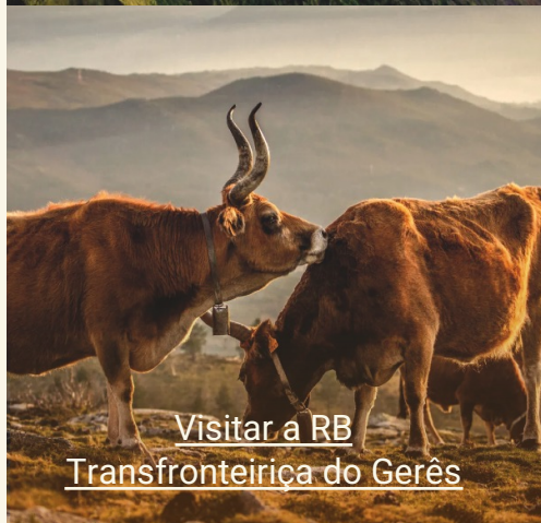
Visitar a RB Transfronteiriça do Gerês