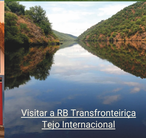
Visitar a RB Transfronteiriça Tejo Internacional