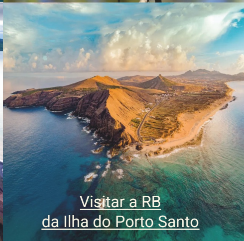
Visitar a RB da Ilha do Porto Santo