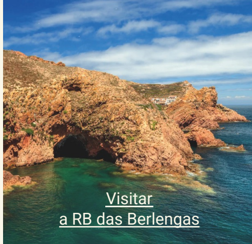
Visitar a RB das Berlengas