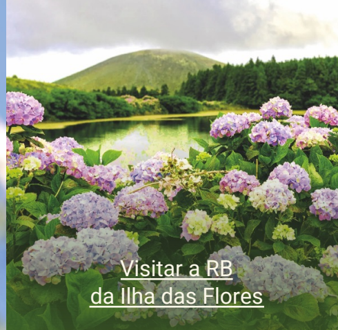
Visitar a RB da Ilha das Flores