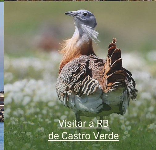
Visitar a RB de Castro Verde