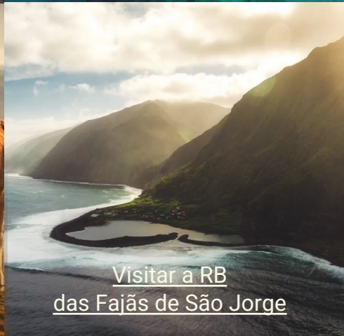
Visitar a RB das Fajãs de São Jorge