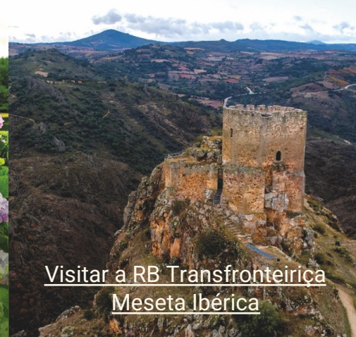
Visitar a RB Transfronteiriça Meseta Ibérica