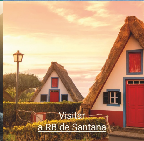
Visitar a RB de Santana