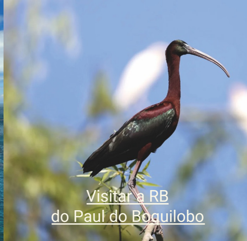
Visitar a RB do Paul do Boguilobo