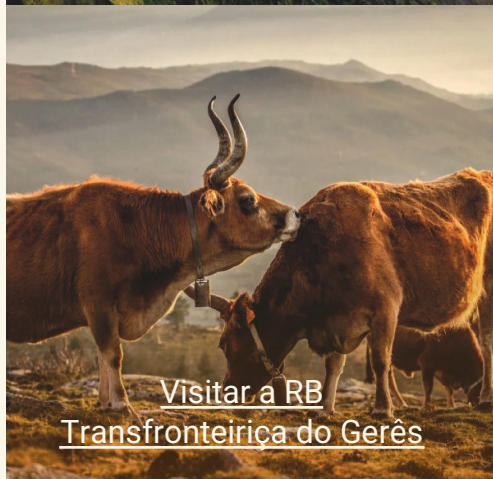
Visitar a RB Transfronteiriça do Gerês