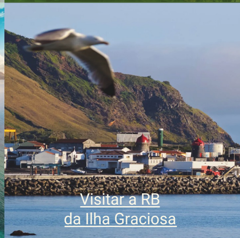
Visitar a RB da Ilha Graciosa