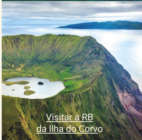
Visitar a RB da Ilha do Corvo