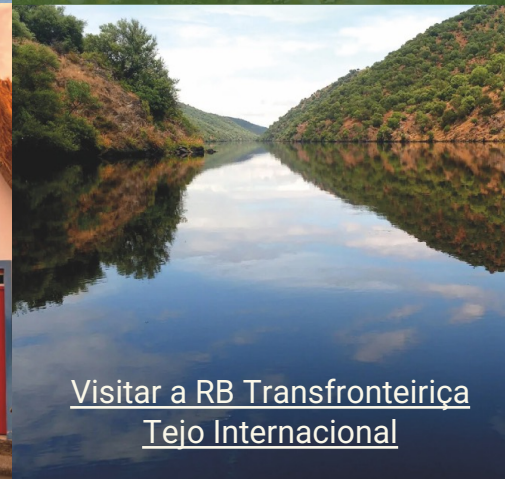
Visitar a RB Transfronteiriça Tejo Internacional